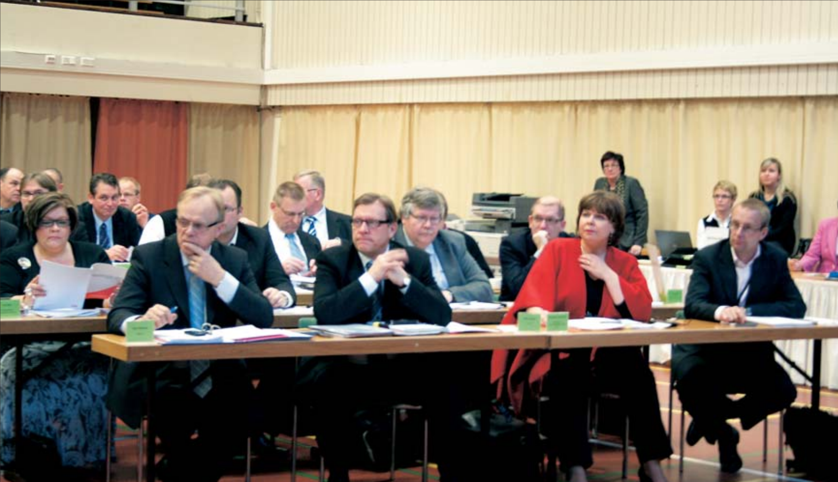
Taluskriisi veti liittojohtajat vakaviksi SAK:n valtuuston kokouksessa.

Sosiaaliturvan uudistamisen tavoitteena on sen parantaminen, mutta nyt uudistuksen varjolla on menossa poliittista suhmurointia työttömyyskassojen jäsenten turvan heikentämiseksi. Kassojen maksamat päivärahat pitivät lamavuosina huolta kymmenien tuhansien ihmisten toimeentulosta, Ihalainen selvitti.