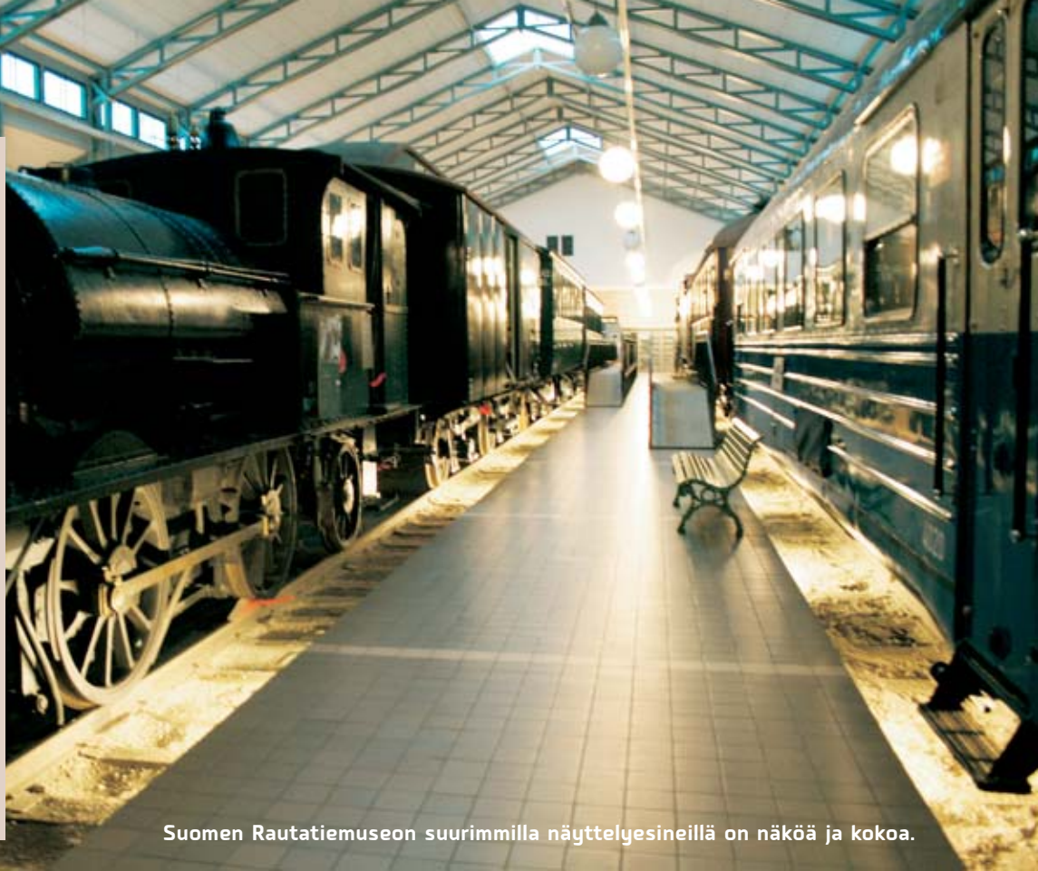
Suomen Rautatiemuseon suurimmilla näyttelyesineillä on näköä ja kokoa.