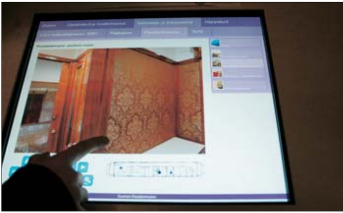
Panoraamakuvia voi ohjata sormen hipaisulla.