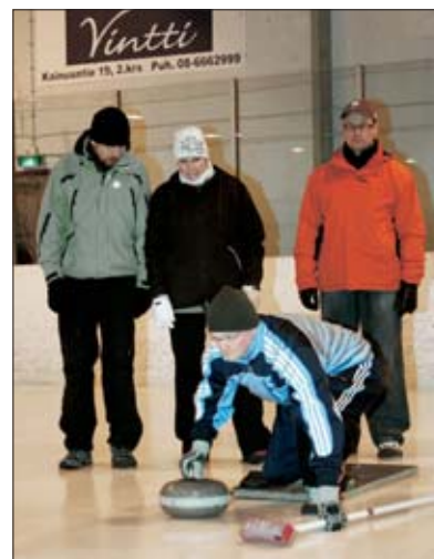
Ay-asian lomassa rentouduttiin curlingin parissa.

Punaisista nenistä voimaa saatuamme vuorossa oli ”tiukkaa ay-asiaa”. Määritelimme muun muassa jäsenten velvollisuudet. Aina puhutaan, miksei liitto tee mitään tai miksi se juuri tekee niin. Tällä kertaa tapaamisessa lähestyttiin roh-