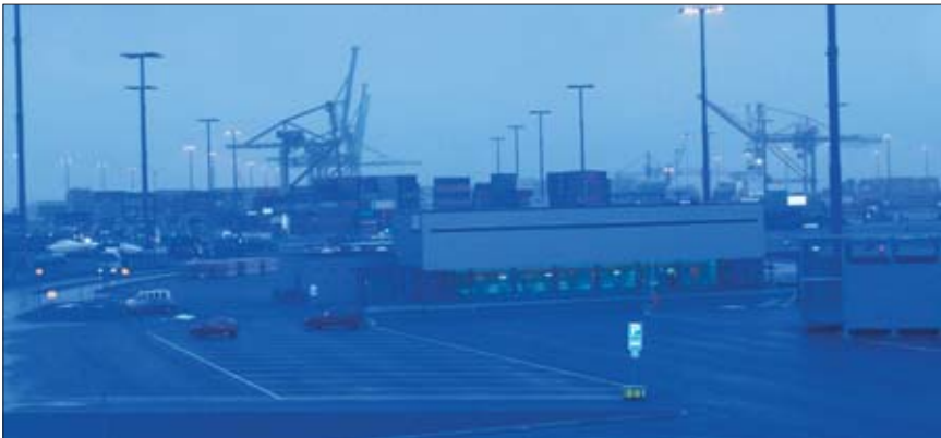
Uudesta Vuosaaren satamasta kulkee konttien matka meille ja maailmalle.

Äskettäin avatun Vuosaaren sataman uutuuksia on radio-ohjattava veturi. Se on tärkeä osa Suomen ulkomaankaupan logistista virtaa ja Vuosaaren vaihtomiesten työpäivää, jonka se kääntää uuteen asentoon. Veturia ei enää aja veturinkuljettaja, vaan vaihtomies ohjaa sitä radio-ohjaimella, joka on jo saanut lempinimekseen ”käkätin” siitä lähtevän käkättävän äänen vuoksi. Käkättimen nappuloita painelemalla vaihtomiehet siirtelevät kontteja ja vaunuja ratapihan ja sataman välillä maasta käsin tai veturin trampilta.