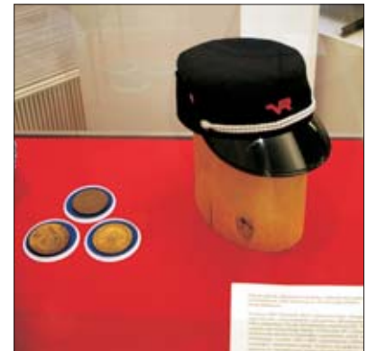
Museossa esitellään myös rautatieläisten virka-asuja. Tässä konduktöörin virkahattu.